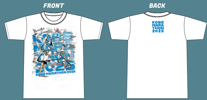
KOBE MARATHON 2025 OFFICIAL T-shirt

今大会のランナー限定で、神戸マラソン2025オフィシャルTシャツの購入ができます。フロントには神戸マラソン2025のメインビジュアルを使用した、特別デザインです。 ※エントリー後の変更はできませんのでご注意ください。